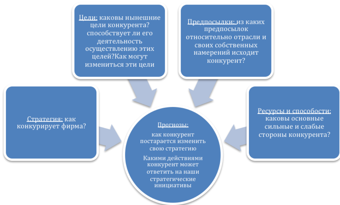
Рис. 1. Структура анализа конкурентов